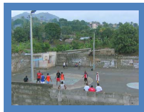
Photo du Stade CASO avant la rénovation

Le stade de Basket de Ouani – appelé couramment stade CASO – a bénéficié d'un financement dans le cadre du projet de co-développement lequel a permis sa rénovation. Trois parties ont contribué financièrement au projet : la coopération française, la communauté ouanienne locale et la diaspora ouanienne de Mayotte.