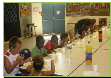
Repas de midi

Quelle journée ! Une journée comme on en rêve. Tous les ingrédients étaient réunis : le beau temps, la famille et les amis autour d'une grande table.