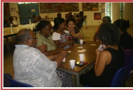
Partie de troufou